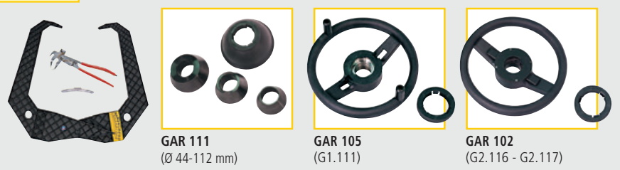
GAR 111 (Ø 44-112 mm)