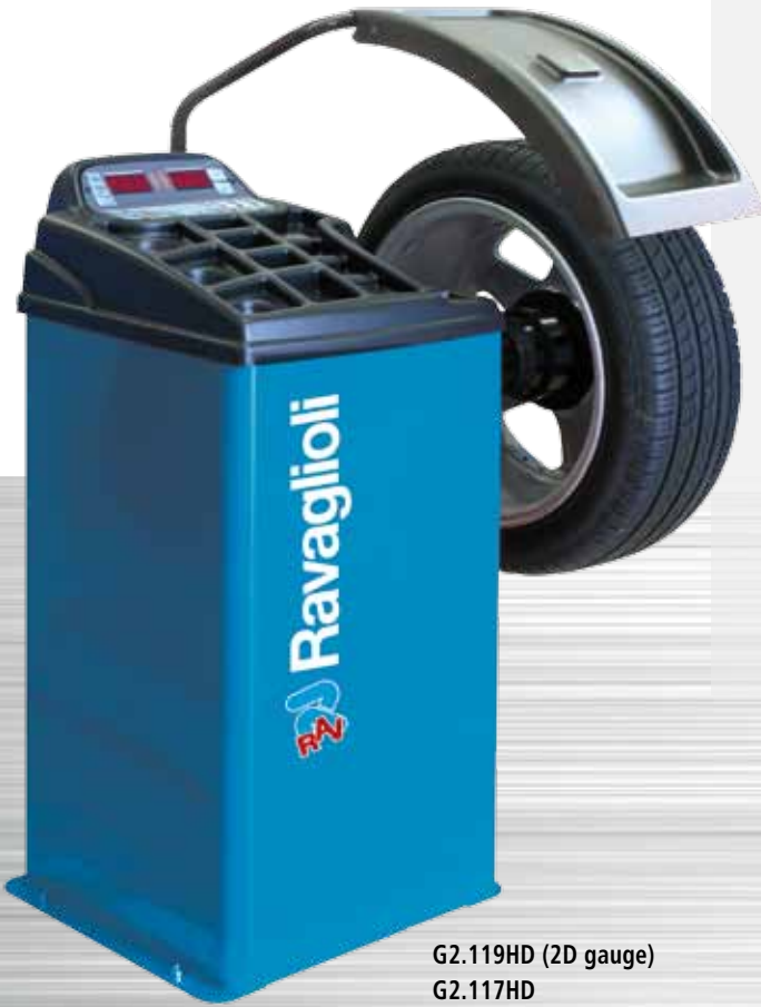
G2.119HD (2D gauge) G2.117HD