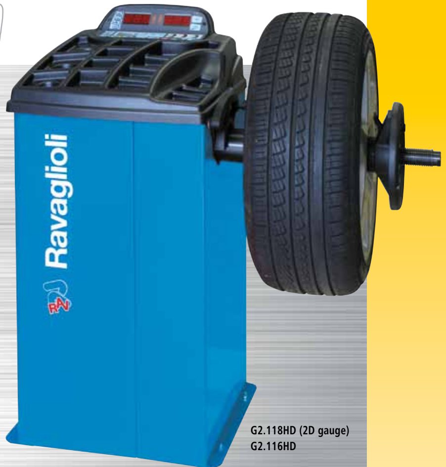
G2.118HD (2D gauge) G2.116HD

Equilibradora de motor con baja velocidad de rotación. Modelo básico de la gama, tiene una excepcional relación calidad-precio. Ocupa un espacio limitadísimo y garantiza prestaciones profesionales.